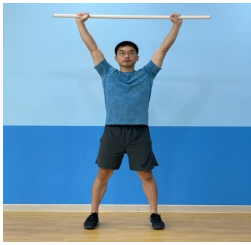
[Fig. 1] Deep Squat(DS)