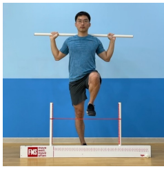
[Fig. 2] Huddle Step(HS)