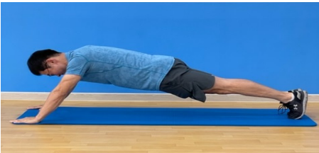
[Fig. 6] Trunk Stability Push Up(PU)