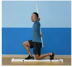
[Fig. 3] In-line Lunge(IL)