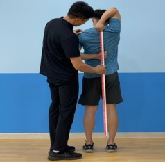
[Fig. 4] Shoulder Mobility(SM)