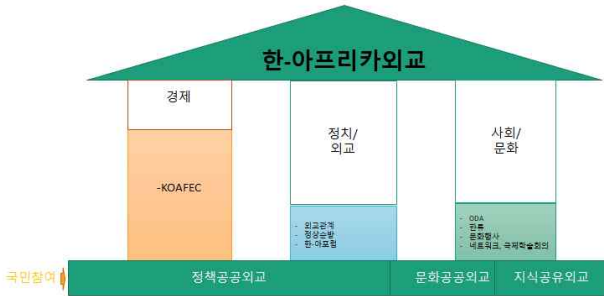
<그림 2> 한국-아프리카 외교 현황