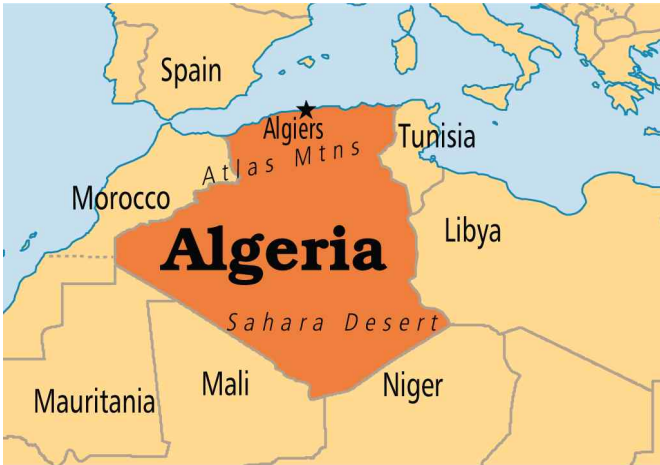
<그림 1> 알제리와 주변국