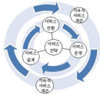
그림 1. ITIL V3 생명 주기[9] Figure 1. ITIL V3 Life Cycle[9]

서비스 라이프사이클은 5개의 구성 요소로 이루어져 있다. <그림 1>과 같이 서비스 전략을 중심으로 서비스 설계, 전환, 운영이 회전하면서 지속적 서비스 개선을 위해 잠시 멈추고 개선이 끝나면 다시 또 회전하는 형태로 되어 있다. 각 요소들은 상호 영향을 미치며 입력물과 피드백에 대해 서로 의존한다. 서비스 라이프사이클 동안에 지속적으로 점검하고 조정하는 활동을 수행함으로써 변화하는 비즈니스 수요에 맞게 IT서비스가 효과적으로 대응할 수 있게 된다[9].