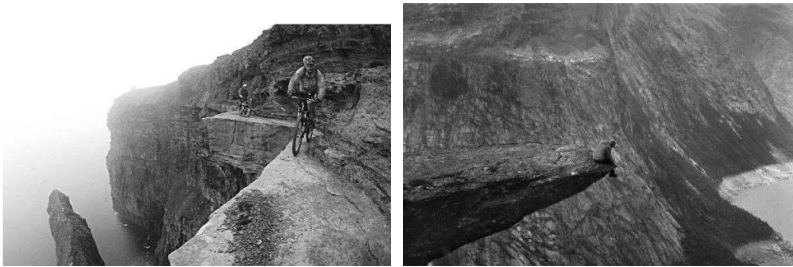
〈천 길 낭떠러지 절벽서 자전거 타고 질주?〉 18)

언어-문학영재들의 상상력을 확장하는 방법으로 사진이나 그림을 활용한 상상력 구체화 작업을 들 수 있다.