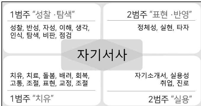
[그림 3] 자기서사적 글쓰기 관련 핵심주제어 범주

이상의 논의를 참고하여 2005년도부터 2017년도까지의 ‘자기서사적 글쓰기’ 관련 글쓰기교육에 관한 기존 연구결과에서 활용된 여러 요소 중 자기서사적 글쓰기 목표를 중심으로 관련된 핵심주제어를 정리하면 다음 [그림 3]과 같이 4가지 범주로 분류된다.