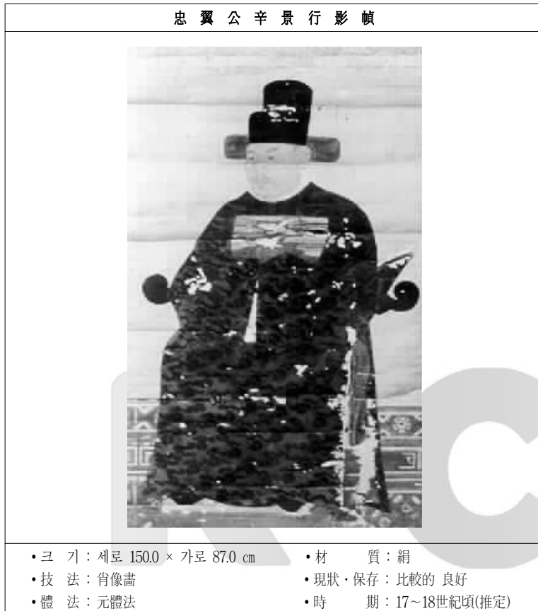
〈그림 2〉 忠翼公 辛景行 影幀

그러나 忠翼公 辛景行의 생시에 사용되던 冠帽의 높이는 낮았던 것에 비하여 이 影幀에는 관모가 높게 표현되어 影幀이 새로 그려진 시기가 다소 후대인 것으로 평가되고 있다.