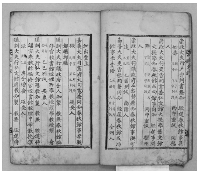
<그림 4> 韓古朝51-나142

2) 서문을 쓴 閱點의 관직이 A본에서는 正憲大夫吏曹判書라 표기되어 있으나,