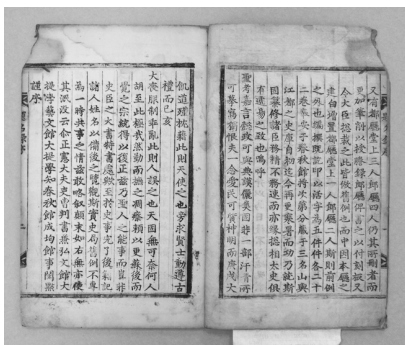
<그림 1> 古2153-1 서문

1) A본에는 서문을 쓴 시기가 기록되어 있지 않으나, B본에는 丁巳 3월이라 밝히고 있다. 丁巳년은 숙종 3년(1677) 실록편찬이 완료된 시점이다. 그렇다면 B본이 먼저 간행된 것으로 추정할 수 있다.