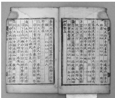
<그림 3> 古2153-1