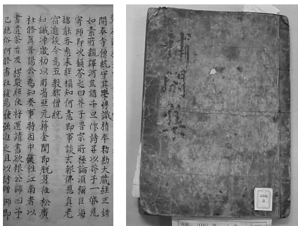
<사진 1> 守其로 쓰여진 『보한집』과 해당 면

수기는 守眞으로도 소개되고 있다. 그것은 “개태사의 승통 守眞는 박학정식하여 왕의 명령으로 대장경을 교감하였다.” 2) 는 『보한집』의 기록을 따른 것이다. 그러나 사본 『보한집』 중에서 안정복 친필 추정 의 『성호사설』 뒷면에 필사된 『보한집』에는 <사진 1>과 같이 守其로 되어 있다. 3)