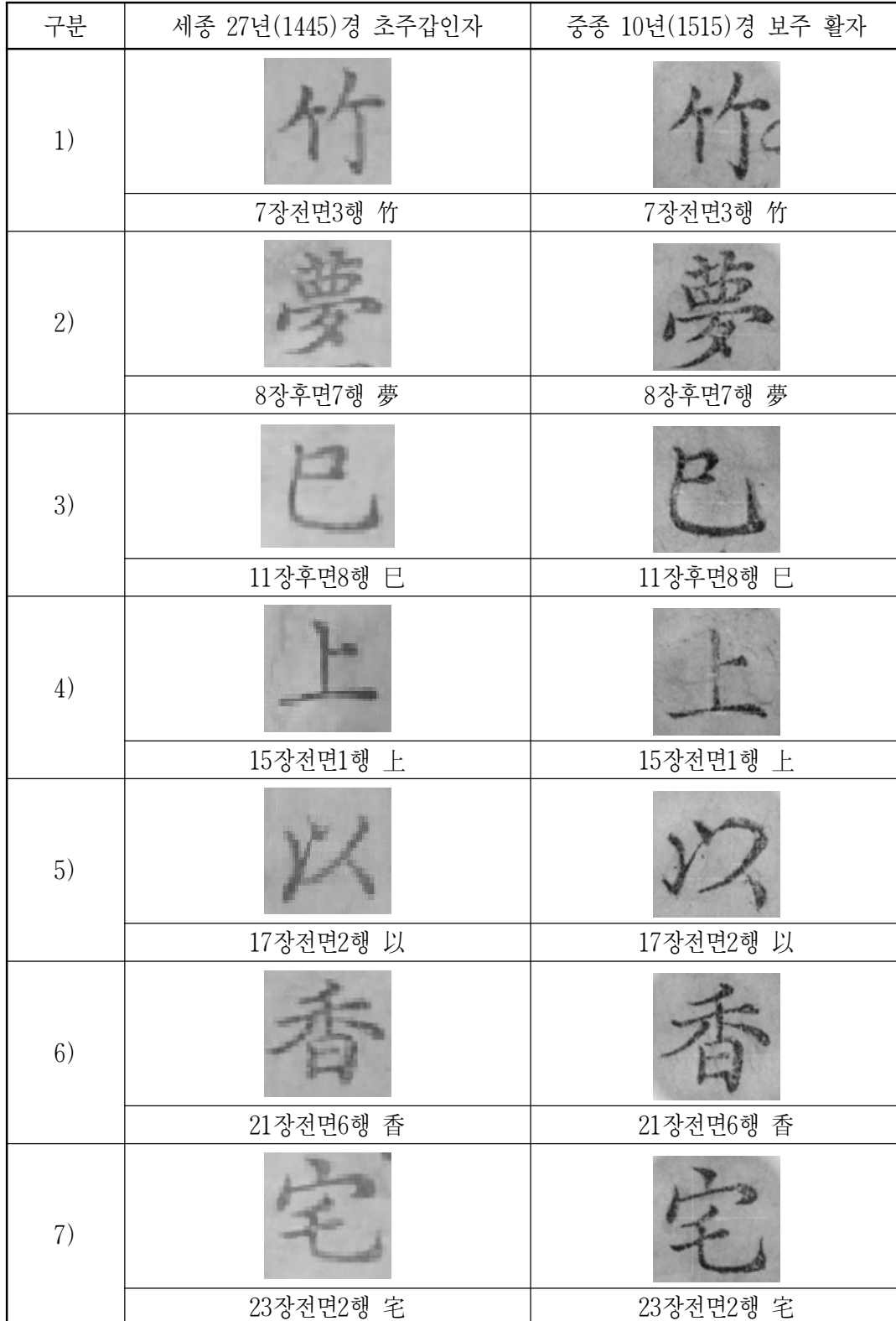
<표 2> 세종 27년(1445)경 초주갑인자활자와 중종 10년(1515)경 보주한 활자의 비교