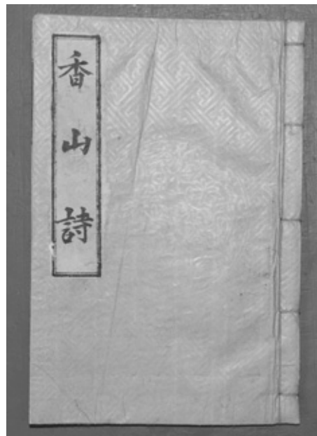
<그림 1> 세종 27년(1445) 간행의 초주갑인자본 『향산삼체법』의 표지 부분

판식은 ‘四周單邊 22.6×15.9cm, 有界, 9行15字, 黑口, 上下內向黑魚尾’이며, 총 42장 중 앞부분 1장-5장, 뒷부분 35장, 38장, 41장-42장에 결장이 있다. 표제는 첨체로 “香山詩”이고(<그림 1> 참조), 책의 권수제 부분과 끝부분에 있는 안평대군 이용의 발문은 떨어져 나갔다.