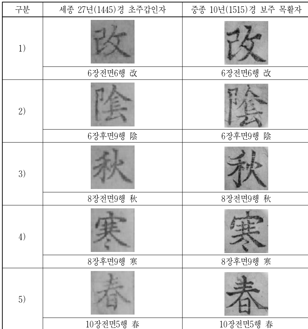
<표 3> 세종 27년(1445)경 초주갑인자활자와 중종 10년(1515)경 보주 목활자의 비교

3) 세종 27년(1445)경에 인출된 초주갑인자 활자와 중종 10년(1515)경의 초주갑인자혼입보자활자들을 비교하여 목활자를 혼용하여 사용한 것을 뒷받침할 수 있는 증거들을 비교할 수 있다. 이들 활자들을 비교하기 위해 위에서 선정된 각 활자들을 10종씩 추출하고 비교하여 본 결과는 다음의 <표 3>과 같다.