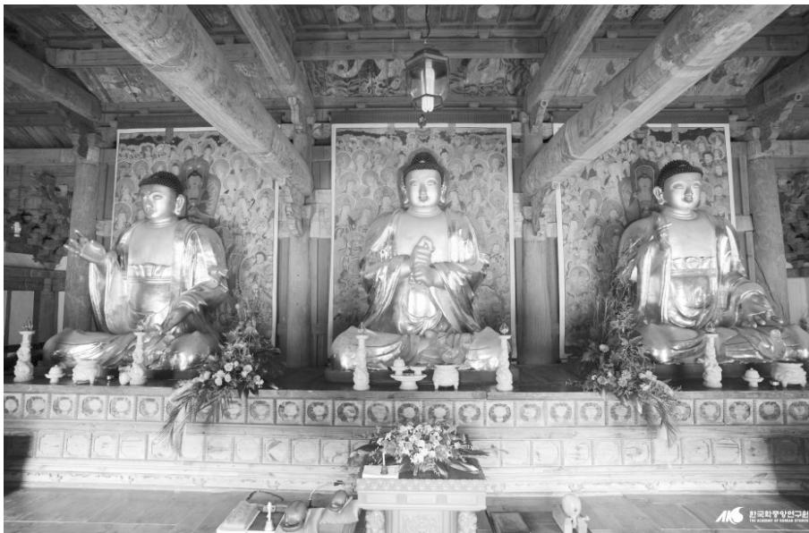
<사진 1> 祇林寺 大寂光殿 毘盧遮那三尊佛 坐像 13)

<사진 1>에서 보는 바와 같이, '경주 기림사 塑造 毘盧遮那三佛 坐像' 11) 중에서 중앙의 本尊佛이 바로 毗盧遮那佛이다. 바로 이 비로자나불 복장에서 1719년에 작성된 2종의 發願文과, 아래 <표 1> ~<표 3>에 제시된 '고려시대의 寫經 및 고려·朝鮮前期 목판본 54種 71冊' 등이 발견되었다. 이러한 '54종 71책'은 1988년 11월에 <보물 제959호>로 일괄 지정되었다. 12)