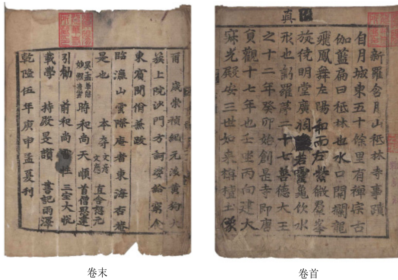
<사진 1> 목담유물자료관 소장 「新羅含月山祇林寺事蹟」

위의 서지사항은 1740년 간본에 공통된 것이며, 소장기관별 전·후쇄의 차이는 있지만 기본 서지사항은 동일하다. 다만 기관별 소장 판본의 전존 상황은 다소 차이가 있기 때문에, 주요 서지사항을 중심으로 그 같고 다른 점을 살펴보기로 한다.