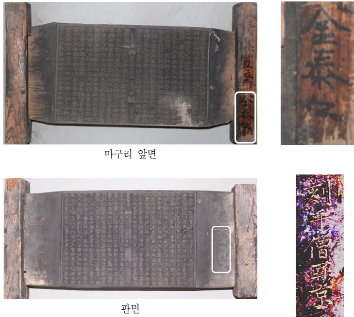
<그림 2> 책판에서의 각수 표기 예

책판에서의 각수명은 상기한 바와 같이 대부분 마구리에 나타나며 일부 판면 밖 공란에도 나타난다. 표기의 방법으로는 붓을 이용해 묵서로 쓴 것, 조각도를 이용해 陰刻으로 파낸 것으로 나누어진다. 대부분의 책판은 책판명, 권차, 장차와 함께 붓을 이용한 묵서로 각수명을 표기하였다. 그러나 『易學圖說』(1645), 『農巖集』(1710), 『谷雲集』(1711), 『安東權氏世譜』(1794) 등과 같이 각수명을 음각으로 표기한 것도 보이는데, 주로 17-18세기에 간행된 문헌의 책판에서 나타났다.