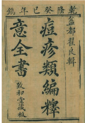
<그림 4> 『치화당각본』 권1의 標題紙(프린스턴대 소장) 49)