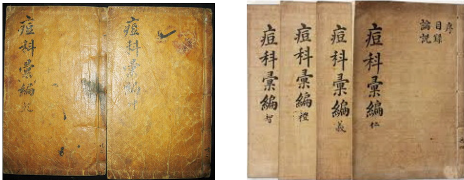
<그림 1> 『두과휘편』(개인 소장) 2책본과 4책본 표지

목판본. 4권 2책이 일반적이지만 종종 4권 4책도 있다. 24) 四周單邊, 반곽 크기는 17.6 × 12.4cm이고 9행 20자 註雙行이며 上黑魚尾이다. 표지에 “痘科彙編”이란 표제가 있으며 제책방식에 따라 “乾, 坤”(2책) 또는 “仁, 義, 禮, 智”(4책) 등이 기록되어 있다(<그림 1> 참조).