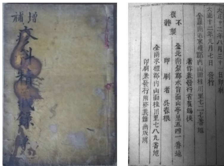
<그림 6> 『증보진과정의록』(개인소장) 표지와 판권지

『두과회편』은 비록 중국 의가의 책이지만 『두창경험방』에 익숙한 기존의 조선 의가들의 경험을 적용시켜 해석할 수 여지가 있었고, 이러한 의서의 도입을 통해 조선 두창학은 한 단계 더 도약할 수 있는 기회를 얻었다. 『동의보감 소아문』을 통해 명대까지의 중국 두창학을 정리하고 『연해두창집요』라는 새로운 틀을 만들어 낸 뒤, 그 틀 안에서 『두창경험방』 이후의 의서들은 조선의 치료 경험과 의안들을 담아갔다. 18세기 후반에 소개된 『두과회편』 등의 중국어서는 조선과 단절되었던 중국 두창학의 성과를 조선의 의가들이 수용하고 조선화하는데 주요한 역할을 맡는다. 『두과회편』의 내용을 활용하여 조선에서 저술된 사례로 『增補疹科精義錄』을 들 수 있다. 이 책은 청대 의가 楊起嚴의 저작인 『疹科精義錄』(1708년 추정)을 중심으로 하여 『동의보감』, 『두과회편』의 천연두, 홍역 관련 내용들을 발췌해 이론을 보충하고 임상위주로 편제를 바꾸었는데, 모본인 『진과정의록』 자체도 『두과회편』에서 많은 부분을 인용하고 있다(<그림 6> 참조). 57)