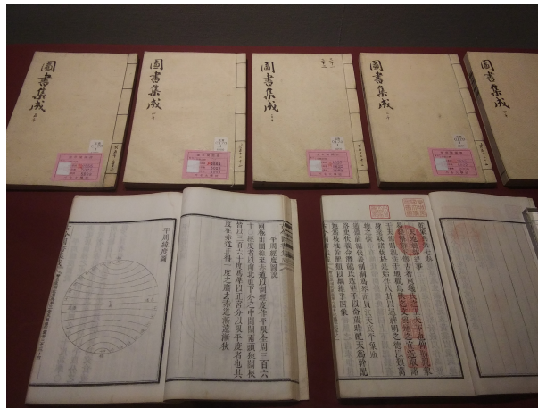
<그림 3> 『고금도서집성』(규장각 소장) 45)

이전 통용본이다. 이 『고금도서집성』은 1777년(정조 1)에야 동지사행에 의해 한 질이 구입되어 조선에 보내졌다. 44) 그러나 이는 조선의 유일본으로 규장각에 소장되었으므로(<그림 3> 참조), 일반에 회람되거나 보급되지 못했다. 이 판본의 전래 시기는 명확하지만 당시 국내 수용된 판본은 아니다.