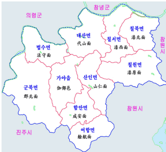
<그림 1> 함안군

오늘날의 함안군은 조선시대의 함안군(咸安郡)과 칠원현(漆原縣)이 통합된 것이다.