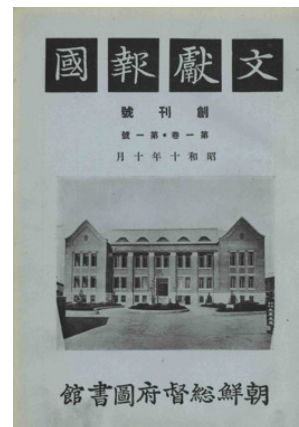
<사진 4> 문헌보국 창간호 표지