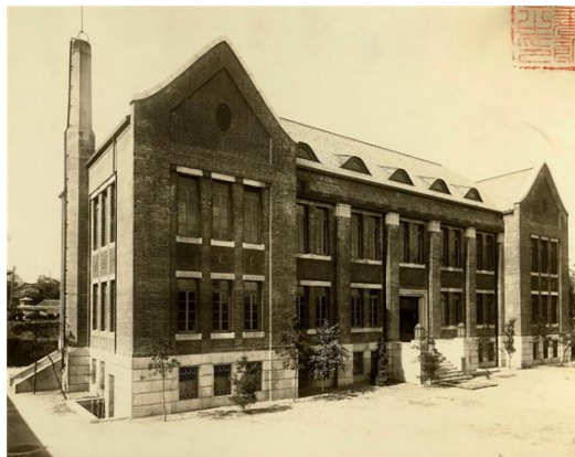
<사진 3> 조선총독부도서관