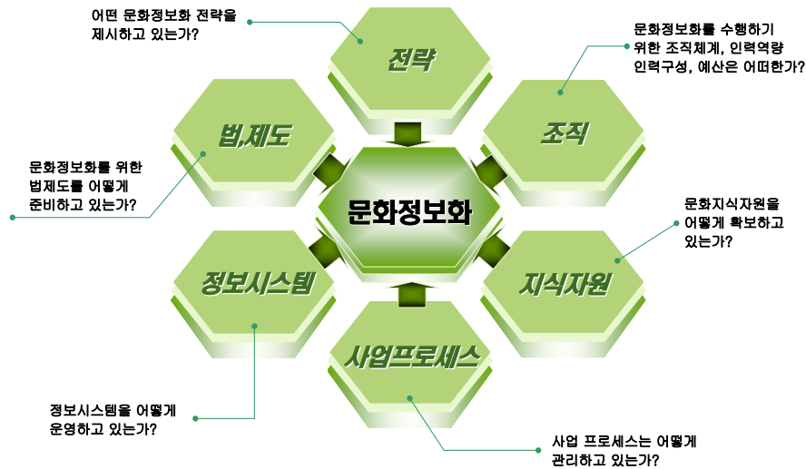
〈그림 1〉 문화정보화 정책적 분석 모형

이 되는 인프라스트럭처라 할 수 있다. 문화예술 전반에 대한 서비스 향상은 물론 문화행정업무의 효율성을 높일 수 있으며, 문화정보를 효과적으로 관리하고 활용할 수 있는 표준화된 기반구조를 형성하게 된다.