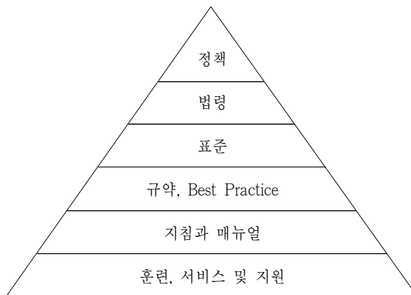
<그림 1> 호주 NSW의 기록관리체계의 기본골격 (State Records New South Wales 2004; 설문원 2005a, 139 재인용)

일반적으로 규약이나 법령, 표준 등의 국가기록관리 구조는 <그림 1>과 같이 피라미드 형태로 최상위에 '정책'과 '법령'이 위치하며 그 아래로 '표준', '규약', '모범사례', '지침과 매뉴얼', '훈련, 서비스 및 지원'이 각각 계층적으로 자리하고 있다.