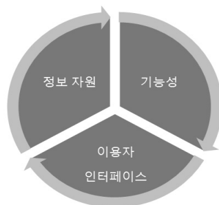
<그림 1> 웹 기반 정보시스템 설계 요소

이러한 웹 기반 정보시스템 설계 시에 고려할 사항 중 웹 구술사료 아카이브 구축을 위한 요소로 본 연구에서는 <그림 1>과 같이 정보 전달, 기능성, 이용자 인터페이스를 제시하고자 한다. 첫째, 정보 전달을 위하여 정보자원의 종류를 선정해야 하는데 여기에는 구조화된 자료 및 비구조화된 자료를 포함해서 텍스트, 멀티미디어 등과 같은 다양한 형태가 있다. 둘째, 기능적 측면으로는 어플리케이션이 제공해야 하는 기능과 수준을 의미한다. 이러한 기능적 측면은 해당 정보시스템의 목적에 따라 서로 다르지만 웹 기반에서 동작하는 정보시스템의 경우에는 상호작용 시스템으로서의 기능을 수행한다. 즉 정보이용자들과의 원활한 상호작용을 수행하기 위해서 네비게이션 측면의 설계가 포함되어야 한다. 또한 하이퍼링크의 설계, 메뉴 설계, 탐색 설계 등도 고려해야한다. 셋째, 이용자 인터페이스 측면이다. 이용자들이 해당 시스템에 대하여 지각하는 용이성으로서, 이용자와 시스템 간에 보다 나은 상호작용을 수행할 수 있고, 과업의 수행도를 높여줄 수 있는 환경을 제공할 수 있다.