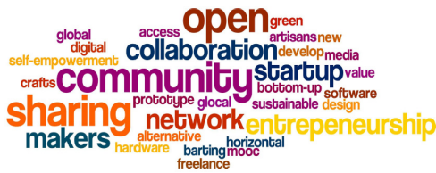
〈그림 1〉 Makerspace 표현 태그셋

Hamilton(2012)은 무한창조공간을 사람들이 도구나 자원을 활용하는 방법을 배우고 창조적인 프로젝트를 개발할 수 있는 곳이고, 기존의 조직안으로 들어가서 설치되거나 독립적으로 설립될 수 있으며 기존의 교육적 목표뿐만 아니라 학생들의 창의적 관심사별로 유동적으로 형성될 수 있는 곳이라고 했다. 또한 무한창조공간은 사람들이 함께 와서 자원을 공유하고 새로운 기술을 배우는 협력적 학습환경이고, 특별한 소재나 공간이 반드시 필요한 것이 아니라 지역사회협력관계, 협업, 창조의 집합체라고 할 수 있는 곳이며, 사람들은 아이디어나 벤처의 인큐베이터인 이 공간에서 콘텐츠를 생산