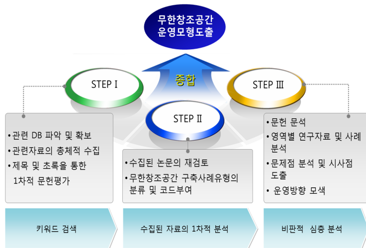
<그림 2> 단계별 문헌분석과정 및 연구과정

<그림 3>과 같은 역할 도출을 시작하는 단계 및 과정에서 지속적으로 제기한 연구 질문은 다음과 같다.