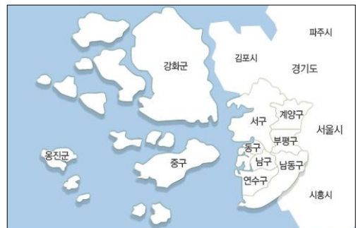
<그림 1> 인천광역시 행정구역

3개의 지역으로 구분하였지만 군집 분석에 사용된 변수에 따라 각 구와 군은 다른 군집에 속할 수 있다는 점과 명확하게 원도심, 신도심, 도농 복합도심으로 구분되기는 쉽지 않고 각 특성이 어느 정도 혼재되어 있는 것이 연구의 제한점이다. 이 제한점을 보완하기 위해 윤현위(2008)와 윤호(2012)의 연구를 기반으로 하여 인천시 제도공간의 변화와 <그림 1>과 같이 8개구 2개 군으로 이루어진 인천광역시의 인구, 주거, 문화 기반 시설, 공공도서관 현황으로 분류하여 그 지역의 특성을 살펴보고자 한다.