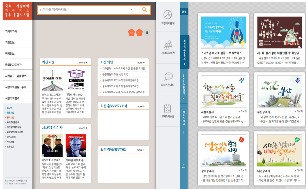
〈그림 1〉 국회·지방의회 의정자료 공유 통합시스템

국회도서관은 이밖에도 국회의원과 보좌직원, 일반 이용자들을 대상으로 의회 및 법률정보의 검색과 활용에 관한 교육을 실시하고 있다. 교육 프로그램의 종류로는 국회의원 보좌직원을 대상으로 국회도서관 법률정보서비스를 소개하고 법률정보 검색교육을 1대1 맞춤형식으로 실시하는 법률정보 검색·활용 교육, 국회직원과 일반 이용자를 대상으로 국회도서관 의회·법률 웹DB를 소개하고 검색방법을 알려주는 웹DB 이용교육, 국회직원과 법학사서들을 대상으로 주요국의 법 체계, 법률정보 활용 및 검색, 법 교양 등 법률정보에 대한 전문지식과 활용법을 알려주는 법률정보 조사과정 교육 등이 있다.