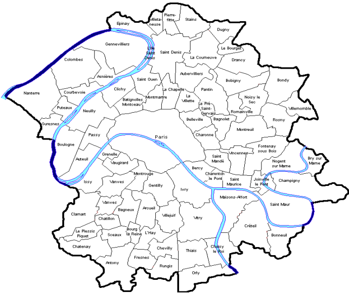
지도 1. 1860년 이전 센 도 및 현 파리의 행정구역(66)