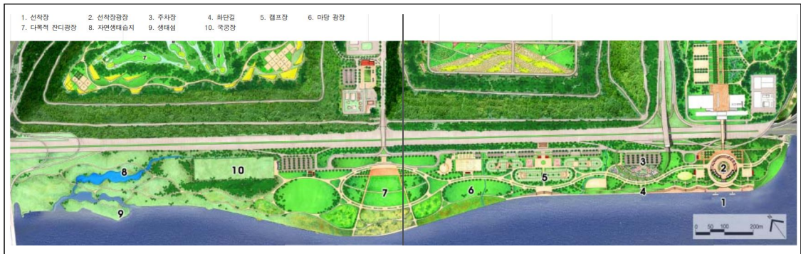
Figure 3_Nanji Hangang River Park Basic Plan