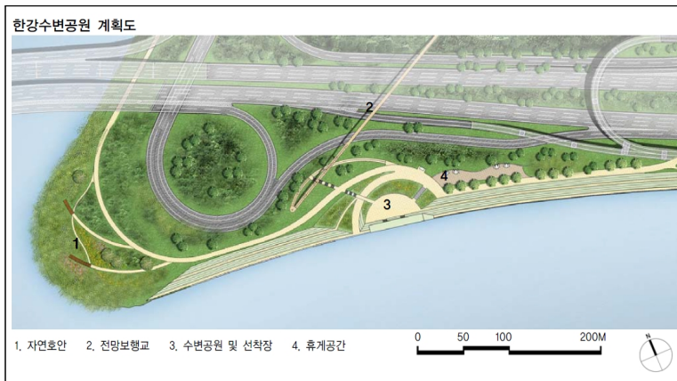
Figure 4 _ Hangang River Waterfront Park Plan