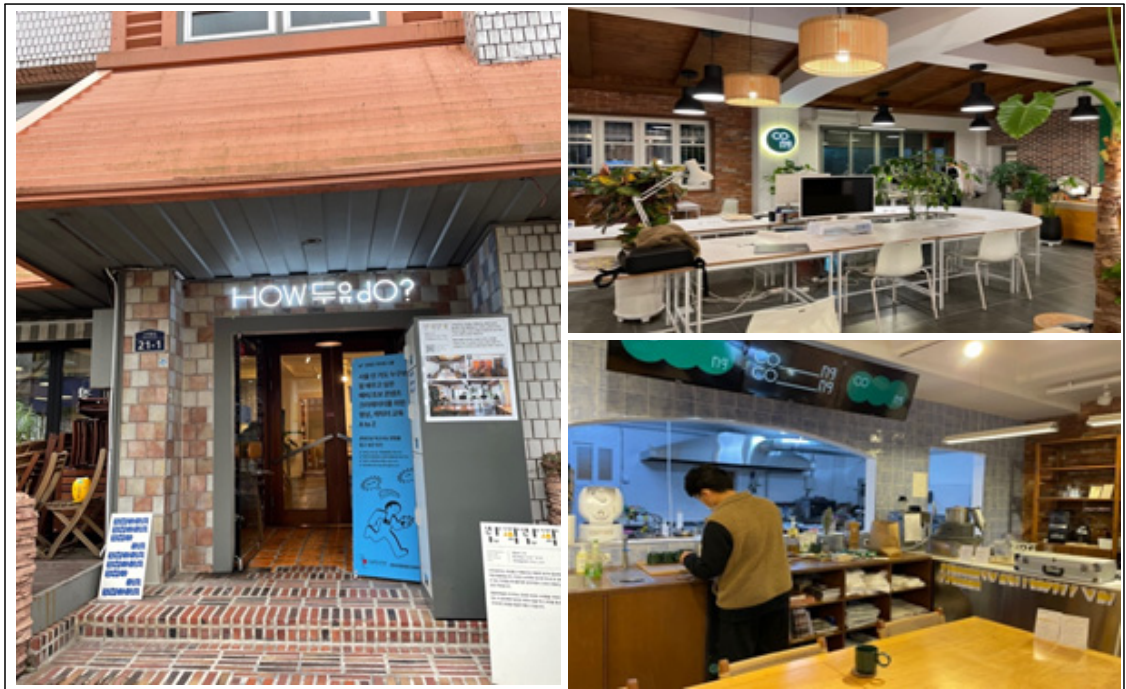
그림 2_목포시의 '반짝반짝 1번지'