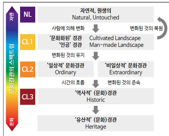
그림 1_문화경관 개념의 전개

주: NL=Natural Landscape, CL=Cultural Landscape.