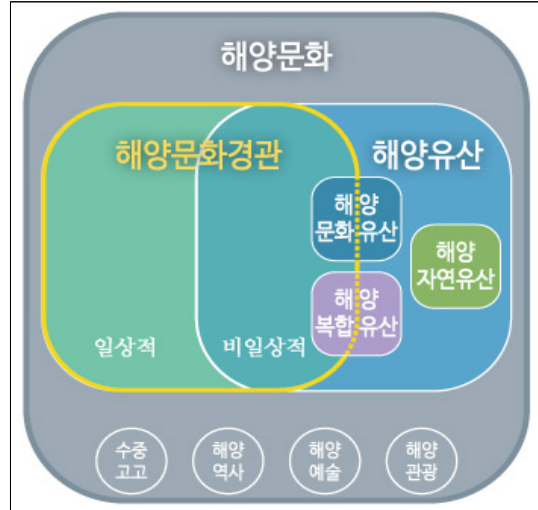
그림 3_해양문화, 해양문화경관, 해양유산 간 체계

있다(<그림 3> 참조). 우리는 이중 이제까지 소홀히 다루어졌던 일상적인 해양문화경관에 대한 가치를 재고할 필요가 있다.