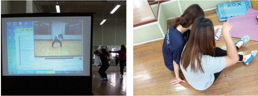
〈그림 2〉 직소모형을 적용한 자기주도적 학습

과제를 할당받은 다른 모집단원들과 전문가 집단을 구성하여 과제를 완성하는 형태의 협동학습 모형으로 30) 이러한 직소모형은 또한 예비체육교사의 티칭 전문성 향상에 도움이 될 수 있는 수업 방식이 된다.