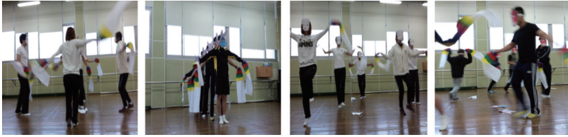
〈그림 1〉 전통 표현 활동(봉산탈춤) 모둠별 창작 활동

항상 느끼는 것이지만 창작이라는 활동은 학생들과 부담감과 스트레스로 시작된다. 하지만 옆에서 학생들을 지켜보면서 느끼는 건 학생들은 어느덧 재미와 성취감과 협동심 그 이상의 만족감을 느끼며 활동 자체에 몰입한다는 것이다. 전통 표현 활동 수업에서 창작 수업은 오히려 다른 그 어느 때의 창작 수업보다 더 의미 있는 수업 이었다고 생각한다(연구자의 수업 반성 일지 중).