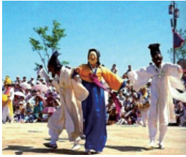
〈그림 8〉 부네를 사이에 둔 양반과 선비 장면 50)