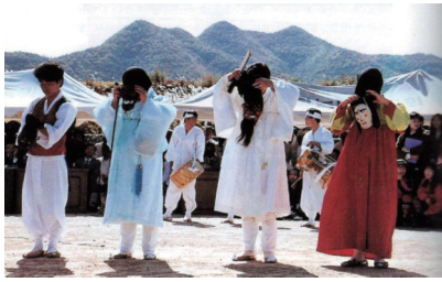
〈그림 11〉 서낭당에 제사를 올린 후 탈을 쓰는 장면 54)