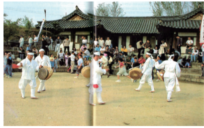
〈그림 12〉 마지막 의식인 ‘허천굿’을 하는 장면 55)

꾼들은 ‘별신굿 기(旗)’를 가운데 두고 극이 시작될 때와 같이 자리를 잡고 조형적인 자세를 취한 채 막이 내린다. 56) 이것은 〈그림 11〉과 〈그림 12〉와 같이 하회별신(河回別神)굿 탈놀이에서 서낭당에 제사를 올린 후 광대들이 탈을 쓰고 탈놀이를 즐기며 굿과 탈춤의 전통을 ‘허천(虛川) 굿’으로써 마무리 짓는 것과 유사한 형태를 띤다. 가장 마지막 의식인 ‘허천굿’은 마을 입구인 허천에서 이루어지며 별신굿을 하는 동안 묻어 들어온 잡귀잡신(雜鬼雜神)들을 쫓아버리는 마무리 굿으로 우리 민족의 자유스럽고 풍요로운 삶을 이루고자 하는 진솔한 삶의 정서가 내재되어 있는 것이다.