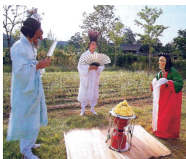
<그림 6> 혼례마당 장면 48)