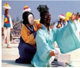
〈그림 9〉 부네가 선비를 유혹하는 장면 51)