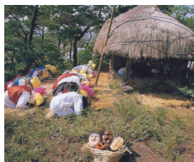
<그림 5> 서낭신을 위한 고사 장면 47)

두 번째로 극의 중반부인 6장은 하회별신(河回別神)굿 탈놀이 중 가장 극적으로 발전된 ④양반과 선비놀이가 도입되었다. 이들은 탈을 쓰고 초랭이와 이매를