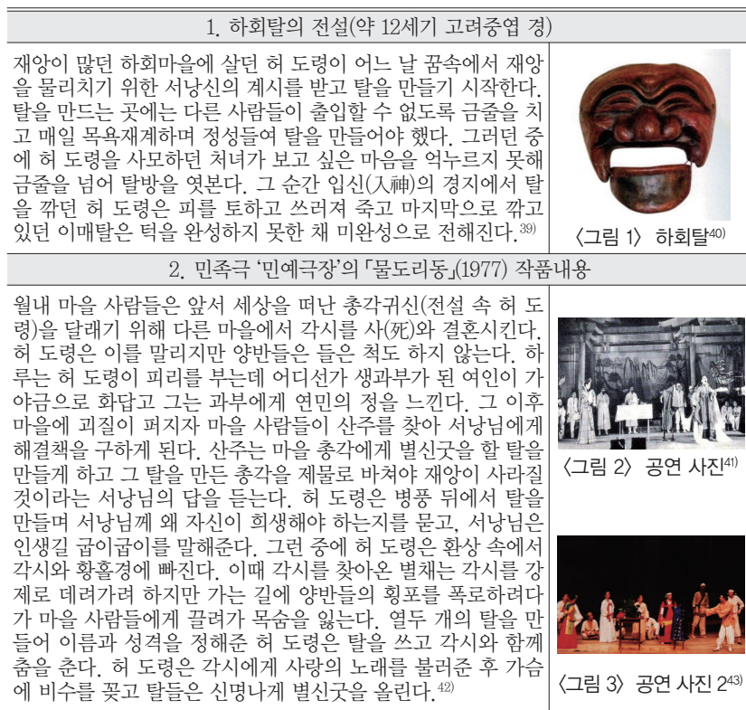
<표 1> 허규의 원작을 기점으로 ‘하회탈의 전설’을 극화한 『물도리동』의 작품내용

서 ‘각시, 양반, 초랭이, 이매, 떡다리, 백정, 부네, 스님’이 등장인물로 현현(顯現)되고 있음을 알 수 있다. 이에 따라 안동 하회마을에 위치한 ‘하회세계탈박물관’ 자료집에 의한 ‘하회탈의 전설’을 포함한 민족극과 극영화의 내용, 그리고 작품에 관련된 사진자료를 모두 정리하면 <표 1>과 같다.