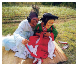
<그림 7> 신방(新房)마당 장면 49)