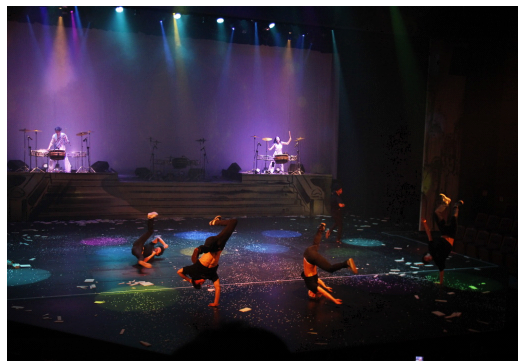
<그림 1> 「비보이를 사랑한 발레리나」와 「탈」 공연의 한 장면