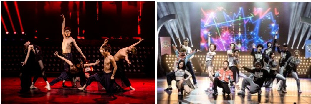
<그림 4> 「댄싱 9」 시즌1 앙코르 갈라쇼 공연 44)

또한 Mnet TV에서 선보인 「댄싱 9」은 순수무용, 스트릿 댄스, 댄스스포츠, 재즈댄스, 벨리댄스, 방송댄스 등 다양한 분야의 무용수들이 출연하여 경쟁을 벌이면서 대중에게 배틀의 재미도 주면서 다양한 춤에 대한 새로운 인식과 관심을 이끌어낸 계기가 되었다. 「댄싱 9」에서 보여준 춤들은 다양한 참가자들이 함께 작품을 만들어내면서 자연스럽게 콜라보레이션 형태를 이루었고 이에 다양한 춤이 조합을 이루면서 복합적인 공연형태를 만들어내었다. 42) 최근 패션, 디자인, 예술 등의 다양한 영역의 제휴를 이끄는 개념으로 콜라보레이션이 인기를 끌고 있으며 43) 「댄싱 9」 프로그램에서 이러한 콜라보레이션의 개념을 도입하여 대중의 감성과 흥미를 이끌고자 시도하였다. 이에 프로그램에서는 유닛공연, 단체공연, 극장공연, 야외공연 등의 다양한 공연형태의 콜라보레이션을 선보이면서 실용무용이 공연예술로서 다양한 영역에서 발전할 수 있는 충분한 가능성을 보여주었다. 특히 「댄싱 9」 프로그램은 다른 춤 콘텐츠의 프로그램과는 달리 프로그램의 종료 후 이화여자대학교 삼성홀에서 갈라쇼 무대를 펼쳤으며 전석매진이라는 대중의 큰 호응을 받으면서 성공적으로 공연을 마치기도 하였다. 2014년 기획된 「댄싱 9」 시즌2 역시 2014년 9월 전석매진이라는 대중의 호응 가운데 성공적인 갈라쇼 공연을 치렀다. <그림 4>는 수많은 관객이 관람한 가운데 출연진들이 화려한 무대를 보여준 「댄싱 9」 시즌1의 갈라쇼 무대이다.