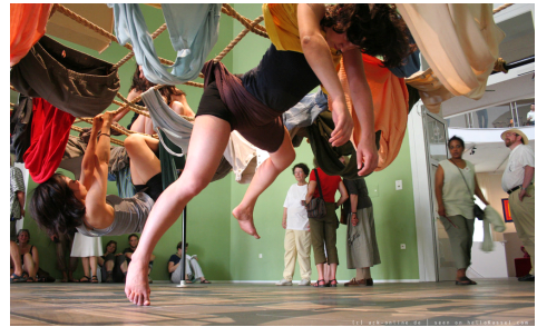
〈그림 3〉 브라운의 「숲의 바닥」2007년 재연 모습

이 작품은 〈그림 3〉에서처럼 네모난 프레임에 격자로 로프가 쳐져 있고, 공연자가 그 사이사이에 끼워진 옷가지를 입거나 벗으며 매달려서 움직이는 형태로 되어 있다. 움직임은 최대한 자연스럽게 진행되었지만 실제로 무용수들에게는 매우 어려운 과제로 주어졌다고 한다. 움직이는 얇은 옷가지에 매달려 옮겨 다니며 단추와 지퍼를 해결해야 할 때 자신의 체중을 지지함과 동시에 대단한 힘과 노력이 필요하였다. 무용수들은 장치에 매달려 중간 중간 휴식을 취해야 했는데 그때마다 장치는 해머이 되었다. 관객들은 아래에 매달려서 움직이거나 장치 위로 올라가서 움직이는 공연자를 보기 위해 몸을 숙이거나 위로 치켜세워 보아야 했다. 16)