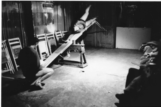
〈그림 1〉 포르티의 「시소」에서 로버트 모리스와 이본느 레이너의 공연 모습

결해 나가는 시나리오를 제시한다. 그러므로 이 작품에서는 안무가가 미리 짜여진 안무를 각본으로 제시하는 것이 아니라 시소라는 도구가 곧 안무적인 기반을 제공하며 즉흥의 출발점이 된다.