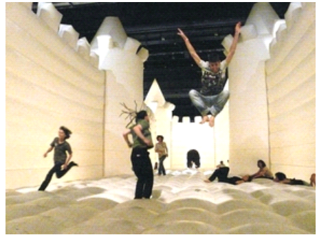
〈그림 4〉 「흰색 바운시 캐슬」 감상을 위해 직접 참여하는 갤러리 관객들