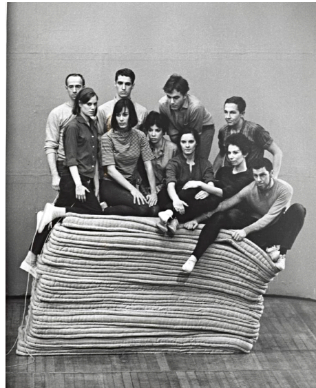
〈그림 2〉 레이너의 「육중주의 일부」에서 열 명의 무용수와 열두 개의 매트리스

http://christopherschreck.tumblr.com/post/109335177540/robert-morris-and-yvonne-rainer-performing-simone