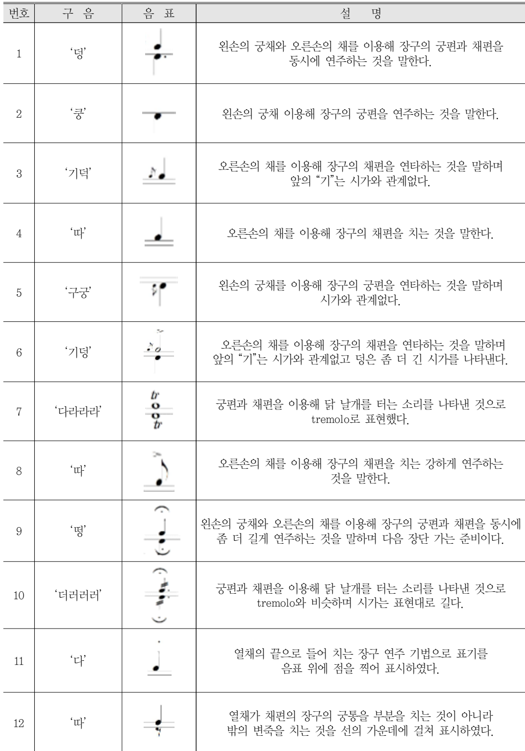
〈표 2〉 장구춤 기보법 정리