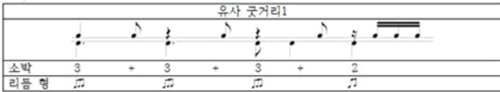
〈그림 1〉 장단 특징 분석

채보된 자료에 제시된 장단 명칭은 일관성을 유지하기 위하여 아래의 〈표 1〉과 같이 표기하였다. 우리나라에서 쓰이고 있는 장단의 명칭은 자의적인 해석으로 장단 빠르기를 느끼는 정도에 따라 그 명칭을 정한 것으로 보이고 같은 리듬형 인데도 불구하고 각각의 명칭이 다르다. 따라서 지역마다 다르게 나타나고, 명칭에 대한 해석도 차이가 있다. 이러한 이유로 채보 단위를 8분음표(♩)를 기준으로 채보·분석하였다.