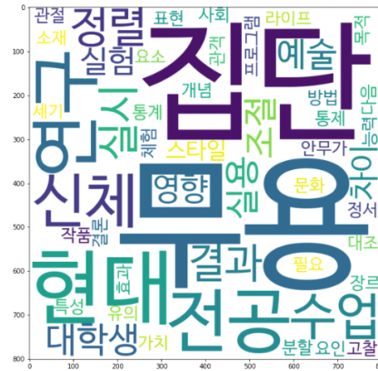
(그림 5) 현대무용 연구주제 토픽4 키워드 시각화

토픽 5을 구성하는 핵심 주제어들의 의미는 무용, 현대, 연구, 놀이, 정서, 교육, 현실, 상태, 프로그램, 유아로 표현되었다. 현대무용은 다양한 음악에 맞춰 한계를 정하지 않은 채로 자유롭게 몸을 표현할 수 있다는 장점을 가지고 있다. 이는 유아들을 대상으로 하는 교육프로그램을 개발할 때 클래식, 동요 등과 같은 다양한 음악적 요소에도 잘 녹여 낼 수 있으며, 창의력과 상상력을 키울 수 있는 교육 동작 들을 바탕으로 자유로운 춤동작도 응용할 수 있다. 또한 표현의 자유로움은 현대 춤의 매력이므로 감성교육과 정서 교육에도 적용시킬 수 있어 이와 관련한 유아 관련 프로그램 연구가 활발히 일어나고 있는 것으로 나타났다. 이에 따라서 토픽5의 잠정적 주제는 ‘유아 대상 현대무용 교육 프로그램’으로 명명 하였다.