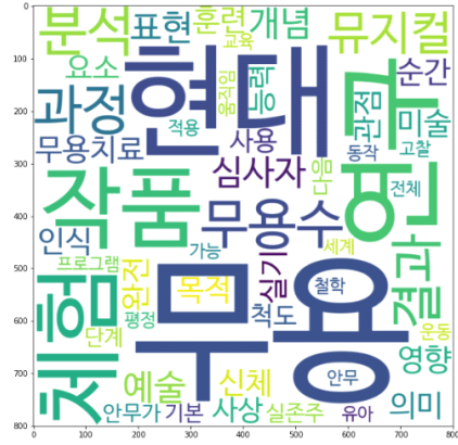
〈그림 7〉 현대무용 연구주제 토픽6 키워드 시각화