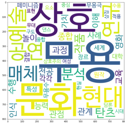
(그림 4) 현대무용 연구주제 토픽3 키워드 시각화