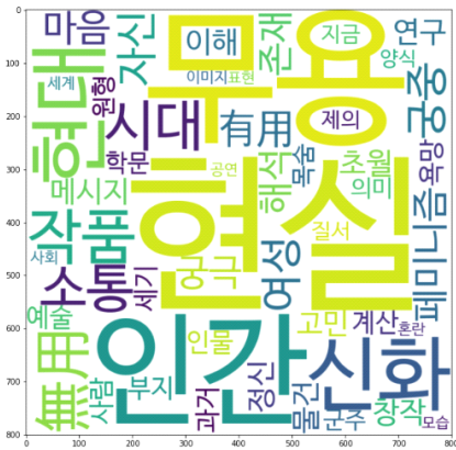
〈그림 11〉 현대무용 연구주제 토픽10 키워드 시각화