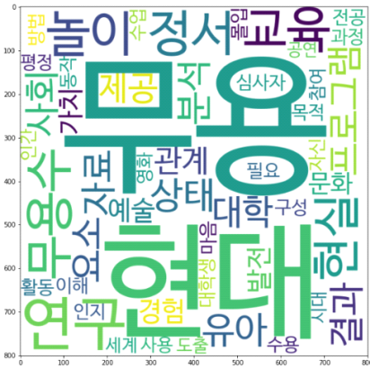
〈그림 6〉 현대무용 연구주제 토픽5 키워드 시각화