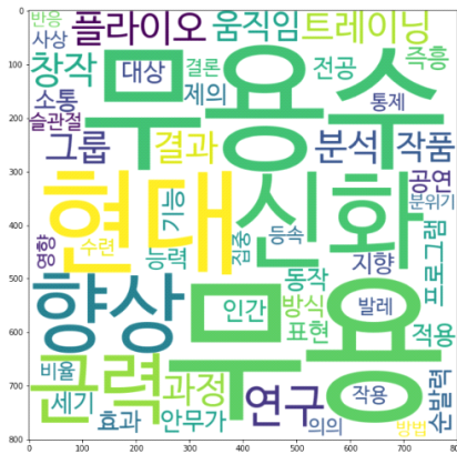
〈그림 8〉 현대무용 연구주제 토픽7 키워드 시각화