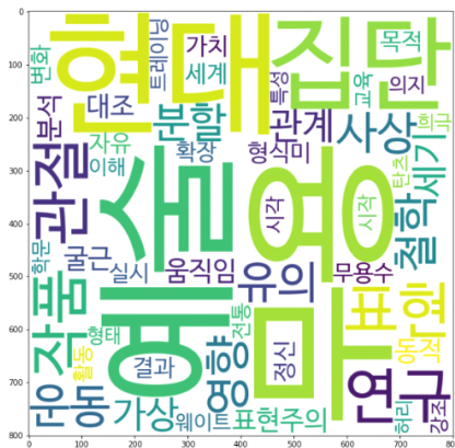
〈그림 2〉 현대무용 연구주제 토픽1 키워드 시각화

토픽4 토픽의 중심어는 무용, 집단, 현대, 연구, 전공, 신체, 수업, 정렬, 실시, 결과로 표현되었다. 현대무용을 전공하는 학생들을 집단으로 신체정렬과 관련한 연구가 활발히 이루어짐을 짐작할 수 있다, 이를 바탕으로 하여 토픽 4의 잠정적 주제는 ‘현대무용전공생 집단연구’라 명명하였다.