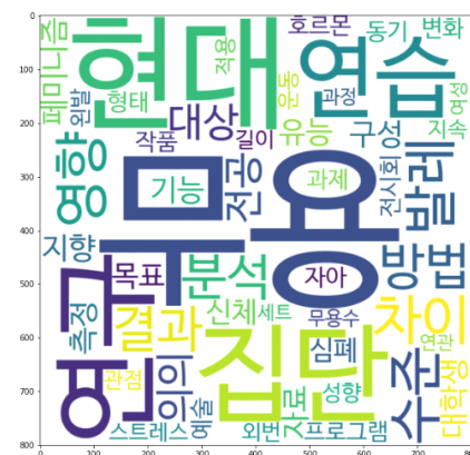
〈그림 9〉 현대무용 연구주제 토픽8 키워드 시각화