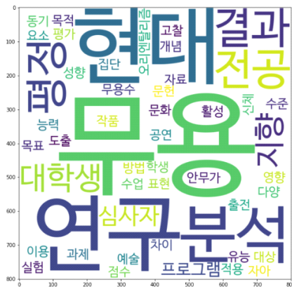
〈그림 3〉 현대무용 연구주제 토픽2 키워드 시각화