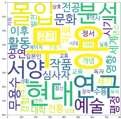
〈그림 10〉 현대무용 연구주제 토픽9 키워드 시각화

에서 시대를 바라보고 연구하고자 노력한다. 따라서 토픽 10의 잠정적 주제어는 ‘시대를 반영한 현대무용 작품’으로 명명하였다.