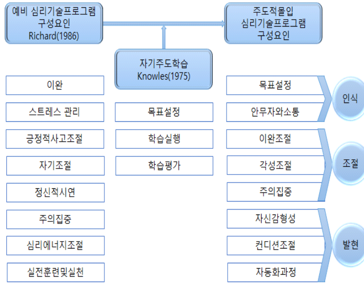
〈그림 3〉 주도적 몰입 심리기술프로그램 구성요인

주도적 몰입 심리기술 프로그램의 첫째과정은 목표설정을 위한 인식과정이다. 자신의 목표를 명확하게 알아가는 과정을 통해 자신의 목표를 재점검하고 확인하며, 작품의 이해를 통해 작품에서 요구하는 목표 등을 안무자와 협의하여 알아가는 과정이다. 둘째과정은 수행을 위한 조절과정이다. 주도적 몰입을 위해 필요한 3가지 요소 이완조절, 각성조절, 주의집중에 중점을 두고 움직임을 통해 조절해 가는 과정이다. 세 번째 과정은 평가를 위한 발현과정이다. 이 과정은 자신이 만들어 온 것에 대한 확인과 확신을 갖는 과정으로 온전히 자신의 춤에 몰입하기 위한 단계로 정신, 신체, 춤이 하나 되기 위한 과정이라 볼 수 있다. 구체적인 주도적 몰입 심리기술 프로그램 내용은 〈표 2〉와 같다.