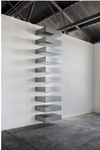
<그림4> 「무제, Untitled」(1966) 15)

한편, 저드는 <그림 4>와 같이 통일된 규격의 기하학적 금속 물체를 사용하여 공간성을 드러내기도 하였다. 이 작품은 규칙적인 배열을 통해 작품을 바닥에서 위로 쌓아 올리며, 확장되는 공간성을 보여주었다 14) . 일정한 공간 간격과 경계를 활용해 공간성을 나타내는 특성은 작품 「스카이 라이트」에서도 나타난다. 이는 구체적으로 ‘무용수의 동선과 군무의 대형을 통한 공간성의 확장’, 그리고 ‘지속적이고 반복적인 움직임을 통한 공간성의 확장’이라는 두 가지 측면에서 살펴볼 수 있다.