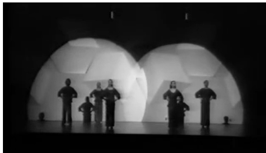
〈그림 2〉 「노래, Song」(1976)의 무대 연출 9)

나의 유기적인 전체성을 이루고 있다. 작품 「노래」에 사용된 음악은 앞서 언급한 것처럼 딘이 처음으로 직접 편곡한 곡으로, 무용수들의 화음을 가미해 움직임과 음악 사이의 유기적 관계를 심화시켰다. 무용수의 화음과 움직임은 변화의 동시점을 공유하며 반복과 변화를 함께 한다. 특히 작품 후반부는 음악의 리듬이 점차 강해지고 춤 동작도 빨라지면서, 음역과 리듬, 다이내믹의 변화가 크게 일어난다. 이때의 음악적 패턴은 마치 무용수의 움직임과 동선에 시간적 윤곽을 설정해주는 것처럼 움직임의 구성과 맥을 같이하며 움직임과 음악의 환상적인 전체성을 만들어낸다. 음악에 나타나는 패턴이 무용수의 움직임을 더욱 단순하게, 또는 기계적으로 보이도록 하여 전체성의 효과가 극대화되는 것이다. 이렇듯 딘의 작품에서는 무용수의 움직임, 음악, 무대 연출이 유기적인 전체성을 이룸과 동시에 이러한 전체성 내에서 지속되는 단순한 반복의 축적은 전체성이란 특성을 더욱 강화시켜, ‘단순성’과 ‘전체성’이라는 저드의 미니멀리즘 특성을 여실히 드러내는 요소가 된다.