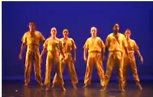
<그림5> 「스카이 라이트, Sky Light」(1982)의 무대 연출 16)

먼저, ‘무용수의 동선과 군무의 대형을 통한 공간성의 확장’이다. 「스카이 라이트」에서 무용수들은 서로 일정한 간격을 두고 정해진 동선에 따라 규칙적으로 움직이면서 단순하면서도 기하학적인 대형을 만들어낸다. 이러한 안무 구성은 공간에 질서감을 부여하고, 무용수 개인 공간과 공간 사이의 유기적인 구분을 형성한다<그림 5 참조>. 던은 이 작품에서 간결하면서도 기하학적인 움직임의 동선과 대형을 통해 동작과 공간을 긴밀하게 융합시켰고, 이 과정에서 무대 공간을 채우거나 비움으로써 공간성의 개념을 극대화시켰다. 이는 저드가 작품을 통해 표현한 “공간을 차지함으로써 공간을 창조한다” 17) 는 공간성의