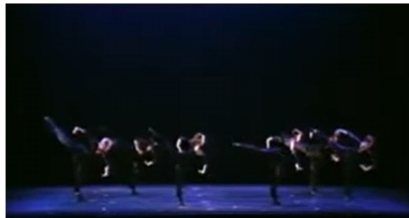
〈그림 3〉 「팀파니, Tympani」(1980)의 무대 연출 10)

이러한 측면은 저드가 잭슨 폴락(Jackson Pollock)의 그림을 평론하면서 강조한 미니멀리즘 표현의 직접성과도 맞물려 있다. 저드는 폴락의 그림은 가정용 액상 페인트를 수평면에 쏟아붓거나 튀기는 드롭 방식으로 관객들에게 완전히 직접적이고 구체적인 느낌을 주는 점이 다른 화가들과 차별화되는 점이라고 평했다(Judd, 2016, pp. 193-195). 이처럼 직접적이고 구체적인 재료를 통해 작품을 구현해내는 것이 미니멀리즘에 기반한 회화에서의 직접성이라면, 무용에서의 직접성은 움직임 그 자체를 있는 그대로 받아들이는 것이다. 「팀파니」의 러닝 타임인 24분 40초 내내 지속되는 섬세하지만 빠르고 격렬한 움직임은 관객으로 하여금 어떠한 상징성이나 구체적인 메시지 없이, 동작의 운동성 그 자체에 집중해 감상하게 만든다. 이렇게 볼 때 「팀파니」는 모더니즘 무용 형식에 적용되었던 ‘의미의 충실함’을 배제하고, 신체 자체를 재료 삼아 미니멀리즘의 직접성을 추구한 안무의 궁극적 결과라고 할 수 있다. 요컨대, 움직임의 본질에 주의를 기울인 작품 「팀파니」는 생동하는 춤을 통해 신체의 움직임 현존에 내재하는 직접성의 의미를 드러냈다는 점에서 저드가 제시한 미니멀리즘의 직접성을 반영하였다고 해석된다.