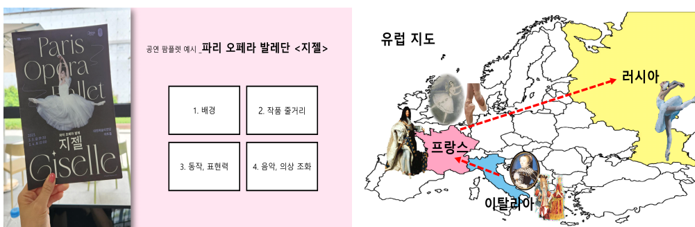
〈그림 3〉 공연 감상법 7)8) , 발레 역사 이론 자료 9)

연구 참여자들은 이론 수업을 통해 발레의 기원과 국가별, 시대별 특징 등을 배우며 발레를 보다 폭넓은 맥락에서 이해하게 되었고, 발레 공연 감상 시에 공연의 의미와 스타일을 더 깊이 있게 인식하는 데 도움을 주었다.