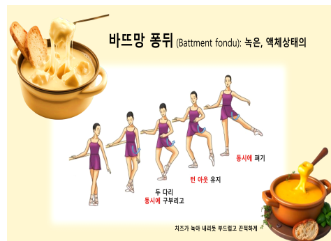
<그림 1> 이론 수업 실행 4) 및 시각 자료 5)