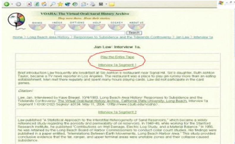
<그림2> 녹음매체별 세그먼트

세그먼트별로 구술내용을 직접 들어볼 수 있도록 하고 있는데, 단점은 녹취내용이 전문이 아니라 요약이라는 점이다. 후술하겠지만, 이러한 이용방법은 기관을 방문한 이용자에게 적절한 인증을 거친 후 이용하도록 하는 것이 바람직하다.