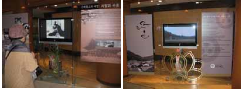
〈사진 10, 11〉 전시장에서 동영상이 상영되고 있는 장면