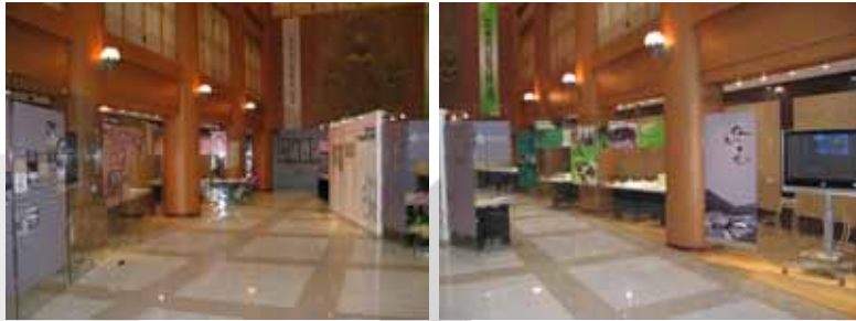
〈사진 1, 2〉 역사기록전시 당시의 전시장 전경

이에 중앙기록관에서는 한국불교역사문화기념관의 개관에 맞추어 발굴된 역사기록을 일반인에게 공개하고자 2005년 11월 14일부터 30일까지 한국불교역사문화기념관 로비에서 기록물전시회를 개최하였다. 본고에서는 중앙기록관 역사기록전시 「기록으로 보는 한국불교와 조계종」의 기획, 기록물 선별, 전시 실체에 대하여 간략히 소개하고자 한다.