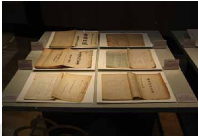
〈사진 8〉 기록물 디스플레이의 예

극복하고자 하였으나 잘 이루어지지 못했다. 실제 행정기록물을 전시하는 상황에서 박물관 전시처럼 다양한 형태의 전시대를 구성하지 못하는 것은 어쩔 수 없는 한계로 남는다.