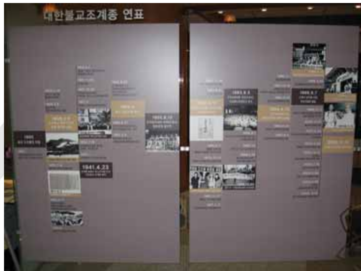
〈사진 9〉 전시장 입구에 설치되었던 연표

려의 도성출입 허용 시기부터 2005년 11월 한국불교역사문화기념관의 개관까지 약 100여년의 시기에서 역사적으로 중요한 사건들을 나열하였고, 수차례에 걸쳐 자문을 받고, 문구를 수정하였다. 또한 불교사 정리에 있어 정치적으로 민감한 사안에 대한 적극적인 해석은 피하였고, 근현대 한국불교사에 있어 가장 중요한 사건들만을 추렸다. 실제 전시에서는 주요사건에 사진을 첨부하여 시대적 흐름을 파악하는데 이해를 도왔다.