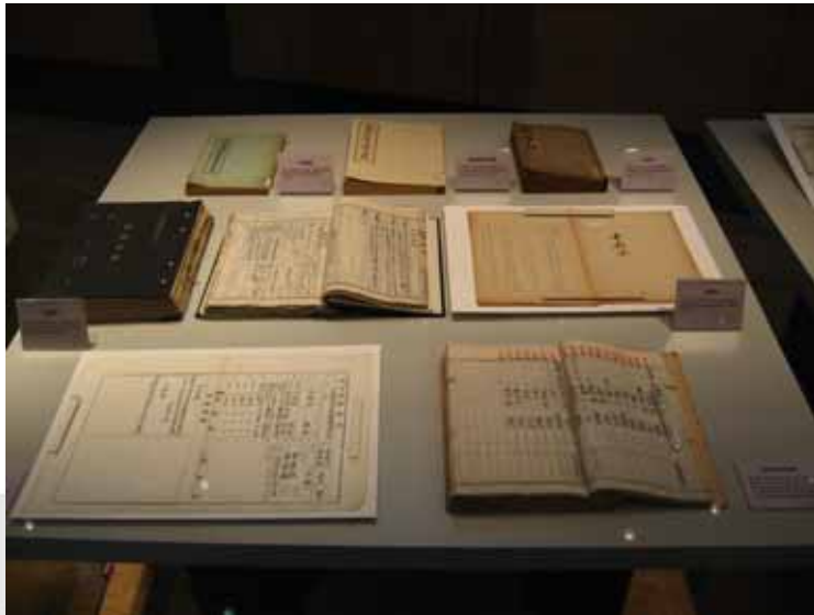
〈사진 3〉 '1부; 되돌아보는 조계종의 숨결'에 전시된 각종 기록물