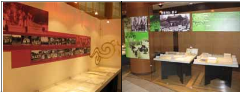
〈사진 6, 7〉 전시에 사용된 각종 전시기법

위에서 유리 벽면에 그래픽으로 처리하였다. 연대사 전시 부분은 역사적 의의를 갖는 사진을 시대 흐름에 맞게 배열하였고, 비교적 많은 양의 사진을 실었다. 주제별 전시 부분에는 정보 전달보다는 해당 코너에 대한 배경 이미지로 부합되는 것을 선별하여 꾸몄다.