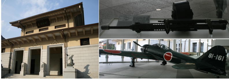
〈그림 2〉 유슈칸(遊就館)과 내부 전시물

1999년에 세워진 ‘쇼와칸(昭和館)’은 쇼와(昭和)시대의 생활사 전시관으로 1926년부터 1989년까지 중에서 특히 태평양 전쟁 당시와 패전이후 일본 민중들의 생활상을 살펴 볼 수 있도록 당시의 생활용품과 사진, 영상, 음악, 책 등의 여러 유물들을 각 층에 전시해놓고, 어린 학생이나 일반인을 대상으로 시청각실과 자료열람실을 통해 그것들을 보거나 조사해봄으로써 전쟁의 비참함을 실감할 수 있도록 하고 있다.