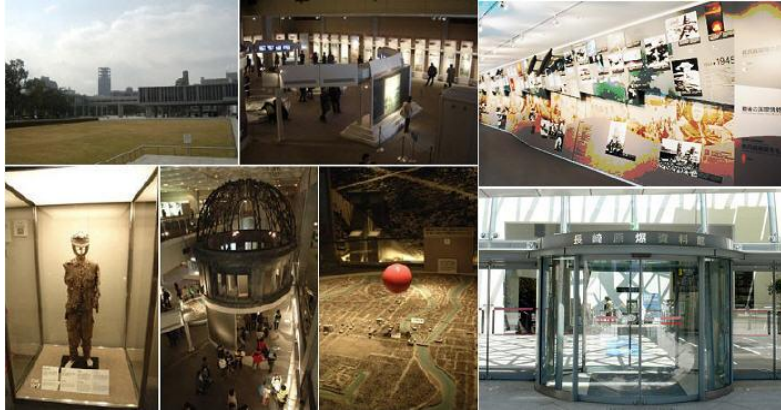
〈그림 5〉 히로시마 평화기념자료관(廣島 平和祈念資料館)과 나가사키 원폭자료관(長崎 源爆資料館)