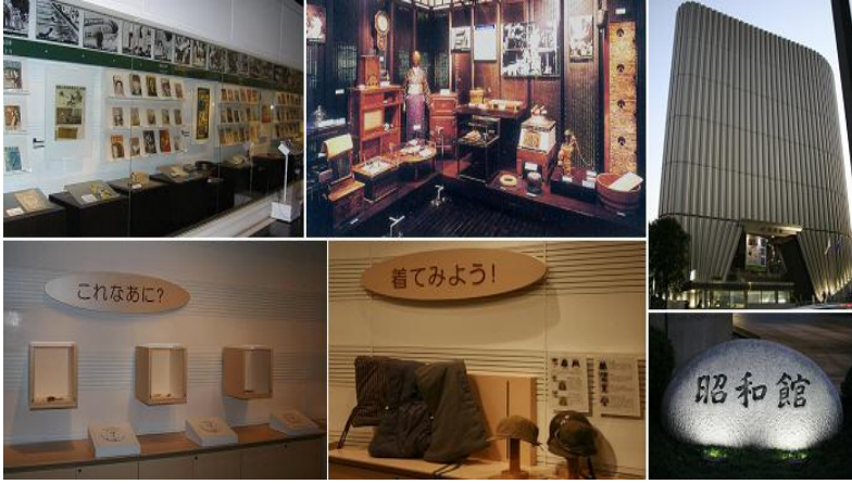
〈그림 4〉 쇼와칸(昭和館)과 내부 전시물

히로시마 평화공원 안에 위치한 평화기념자료관(平和祈念資料館)과 이보다 그 규모는 작지만 나가사키시에 있는 원폭자료관(長崎 源爆資料館)에서는 핵폭탄이 떨어지기 전후의 모습과 핵무기로 인한 당시의 피해참상을 그대로 재현해 놓아 처참했던 순간들을 느낄 수 있게 하였다. 특히 피폭 환자의 생생한 사진들과 조그만 어린이들의 찢어진 옷 그리고 피묻은 소지품 등의 원폭자료 전시, 원폭 피해와 관련한 기록영화를 상영하는 비디오실의 운영, 여기에 원폭과 평화에 관련한 도서의 판매 등으로 전쟁을 모르는 세대에게 원폭에 의한 피해의 실상과 핵무기 개발의 역사, 세계 평화의 중요성을 일깨워주고 있다.