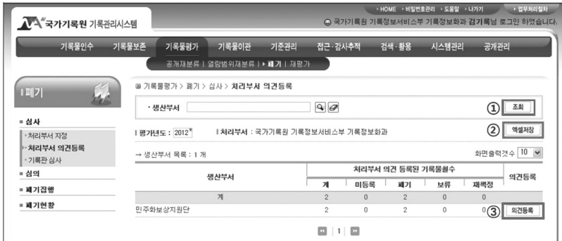
〈그림 5〉 처리부서 의견등록 생산부서 조회기능

의견등록과 관련하여 공통업무를 참조하기 위해 공통업무참조 및 폐기관련 준칙의 기능을 사용할 수 있다. 소기능별 단위과제 - 단위과제 설명 - 보존기간을 참고하도록 하고 있다. 각 단계에서의 '공통업무참조