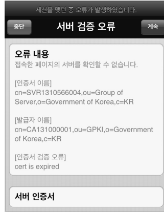
모바일 버전 로그인 오류