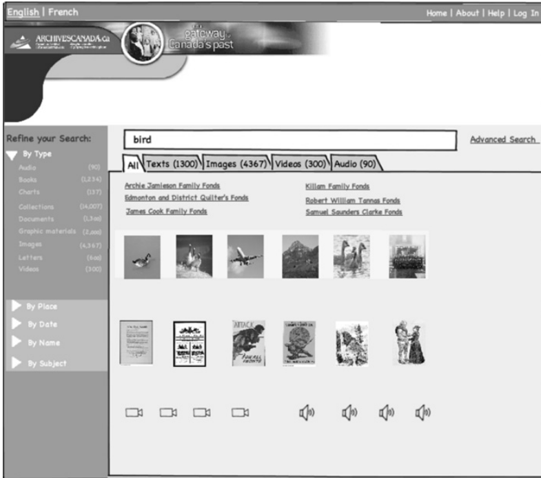
〈그림 2〉 아즈캐나다 목업 작성사례 - 퍼싱 검색