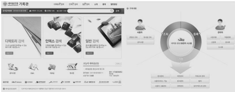
〈그림 1〉 새마을운동 기록관 메인화면 및 구축내용소개

새마을운동 기록관은 새마을중앙연수원의 새마을역사관, 연구자료실 등에 소장중인 새마을운동 관련 일반문서류, 시청각류, 도서류(간행물 포함), 박물관류 등 약 14,000여 종 20,000여 점에 대한 기록물 정보를 담고 있다.