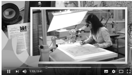
How We Serve Canadians : For the Record