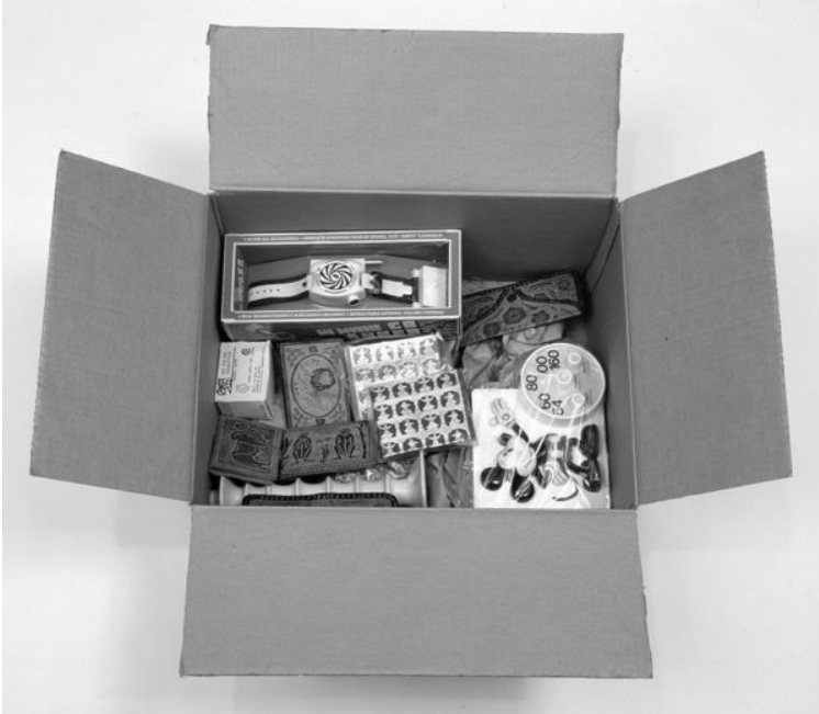
〈그림 5〉 앤디 워홀의 262번째 타임 캡슐

〈그림 6〉부터 〈그림 10〉은 앤디 워홀의 카탈로그 레조네 중 코카콜라 이미지를 이용해 제작한 작품을 하나의 시리즈로 분류한 뒤 함께 기술하고 있다. 각 작품에 대한 세부적인 기술은 작품에 의하며 코카콜라 이미지 작품에 대한 총체적인 정보와 이와 함께 기술했다.