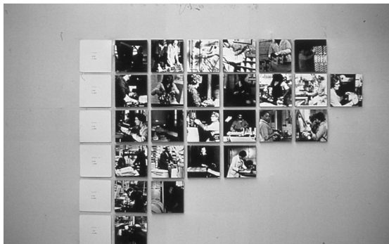
〈그림 2〉 〈Women & Work〉 전시 전경