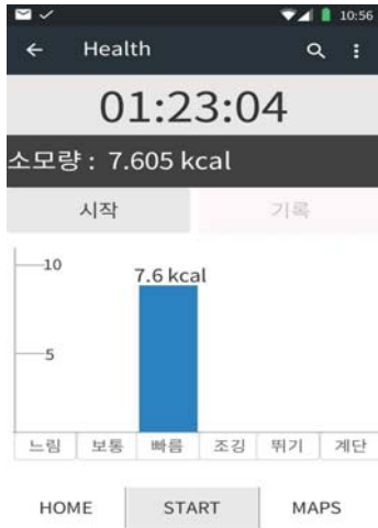
그림 2. 결과 측정 결과 화면 예 Fig. 2. Screen shot from app showing the result of exercise result measurement page