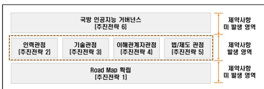
그림 5. 추진전략 제약사항 발생 예상 영역 식별 Fig 5. Identify areas where constraints are expected to occur each strategy

이러한 제약사항은 추진전략 실행에 방해요소로 작용되며 이는 반드시 극복되어야 한다. 하지만 제약사항은 단시간에 극복되기 어렵기 때문에 Road map과 더불어 단계별로 해결되어야 한다. 각 제약사항에 대한 극복방안으로는 아래와 같다.