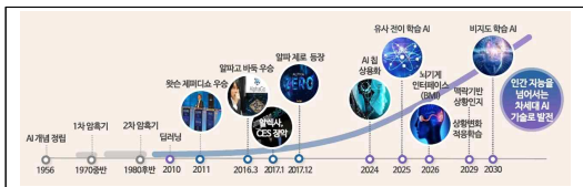
그림 1. 인공지능 발전 추이[3] Fig 1. The Trend of AI Development

논리적으로 판단, 행동하며 감성적·창의적인 기능을 수행하는 능력까지 포함한다[1]. 인공지능은 상당히 오래 전부터 연구되었던 분야이지만 2016년을 기점으로 인공지능이 대중들에게 각인이 되었는데 그 이유는 무한에 가까운 바둑의 수를 학습한 인공지능 알파고와 이세돌 간의 대국 때문이었다. 이세돌이 알파고와 대국에서 1-4로 패배함으로써 대중들은 큰 충격과 더불어 인공지능의 세계가 대중들로 한층 가까이 다가왔음을 피부로 느끼게 되었다. 이를 기점으로 다양한 학습 알고리즘이 파생되었고 실제 서비스와 함께 상용화되어 우리 생활 영역으로 깊숙하게 들어오고 있다. 특히 음성인식 개인 서비스 분야에서 인공지능의 보급화가 두드러졌으며 네이버는 자체 AI 플랫폼인 클로버(Clover) 기반의 웨이브(WAVE), 캐릭터를 반영한 프렌즈를, 카카오는 카카오톡과 연계된 카카오 미니를 출시하였다. 삼성전자는 음성비서 빅스비(Bixby)를 탑재한 스피커를 2018년에 출시하였다[2].