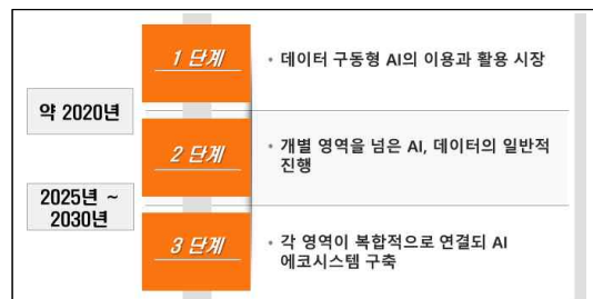
그림 2. 일본 AI 산업화 로드 Fig 2. The Roadmap for AI Industrialization of Japan

기회로 활용하는 정책을 추진하고 있다[4]. ICT를 활용하여 사이버공간과 현실사회를 뛰어넘어 자유롭게 활동이 이루어지는 초스마트사회(Society5.0)를 제시하고[5] 특히, 3단계에 걸친 AI 산업화 로드맵을 통해 궁극적으로 선순환을 위한 에코시스템을 구축하고자 한다. 또한 인공지능에 대해서 중요성을 인식하고 초스마트 사회를 위한 초석 기술로 인식하고 있으며 AI 등 민간 주도로 연구개발 추진이 힘든 것은 국가전략 핵심 기술로 분류하여, 장기적으로 추진할 것을 제안하였다[5]