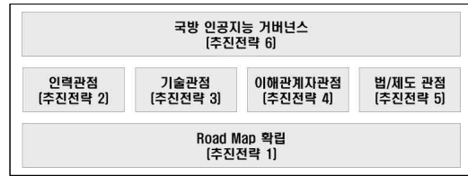
그림 4. 국방 인공지능 추진전략 구성 Fig 4. The Construction of Defense AI Strategy

▷ 국방용 인공지능 관리 및 통제, 가이드라인 제시와 함께 국방 인공지능 성숙도 유지를 위한 지속적 개선