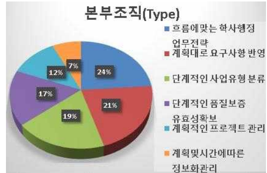
그림 1. 감리 유형별 우선순위 분석 (HQ) Fig. 1. Priority analysis of Audit Type (HQ)