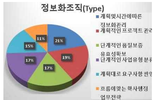
그림 2. 감리 유형별 우선순위 분석 (IT) Fig. 2. Priority analysis of Audit Type (IT)

각 조직에서의 역할별 업무별로 인터뷰를 통해 우선 순위를 중심으로 사업유형별 내용이 도출 되었다.