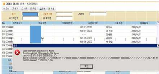
그림 4. 거래처마스터 오류 Fig 4. Transaction Master Error

출물의 요구사항 정의서 및 회의록 등을 참고하여 각 항목별로 하자여부를 확인하였다.