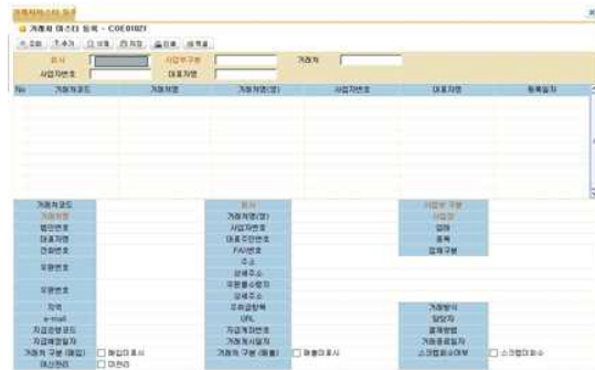
그림 5. 거래처마스터 트랜잭션 기능 Fig 5. Transaction Master Transaction Function

ERP 시스템을 직접 실행하면서 트랜잭션 기능들을 식별하였다. 그림 5의 거래처마스터 등록 화면에서 ‘저장’ 버튼을 누르면 표 3에서 식별된 ‘거래처마스터’ 파일을 갱신하므로 단위 프로세스 유형은 EI로 식별되고, FTR의 수는 ‘거래처마스터파일’의 개수인 1로 산정한다. 이 과정에서 어플리케이션의 경계를 넘는 데이터 필드, 메시지, 기능키는 정의에 의해 DET로 식별하므로, ‘회사’, ‘사업부구분’, ‘버튼’, ‘메시지’ 등 총 36개의 DET가 산정된다.