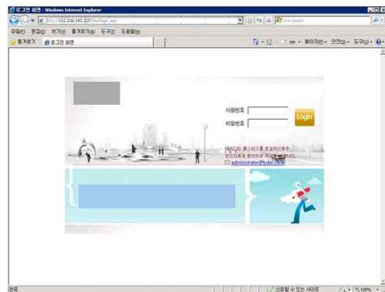
그림 1. 로그인 화면 Fig 1. Login Screen

본 감정의 대상 ERP 시스템은 A사가 B사의 ‘ERP시스템컨설팅 및 구축 용역계약’에 따른 컨설팅 및 용역에 의하여 개발된 시스템이다. 이 시스템은 업무처리절차 재설계, 통합 데이터베이스 구축, 의사소통 활성화를 통해 스피드 향상, 업무의 질 향상, 시너지 효과 창출을 가져오고 궁극적으로 총체적인 생산성 향상을 목적으로 하고 있다.