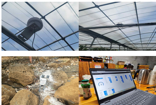
그림 2. 제주 감귤 하우스 내 센서와 데이터 수집 Fig 2. Sensor Deployment and Data Collection in Citrus Greenhouses in Jeju

농업의 경험적 문제를 제주도 실무자 간담회와 현장 방문을 통해 취득하였다. 특히 서귀포시 남원읍에 소재한 감귤 농장의 하우스 감귤과 노지 감귤밭 현장 방문을 통해 감귤 산업 디지털 전환 현황과 문제점을 확인할 수 있었다.