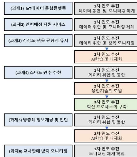
그림 4. 주요 과제별 디지털 전환 추진 로드맵 Figure 4. Task-Specific Roadmap for Agricultural Digital Transformation